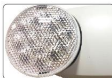
FARO MOVIBLE 12LED